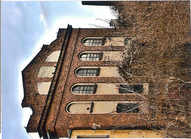
2. Elewacja południowa, 2020.